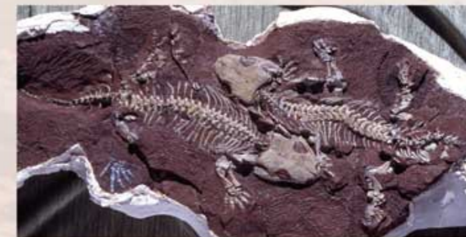
Abb. 7: Tambacher Liebespaar

Und bestimmt ist Ihnen das „Gothaer Liebespaar“, ein berühmtes Gemälde aus dem 15. Jhd. bekannt. Doch kennen Sie auch das „Tambacher Liebespaar“ vom Bromacker? Zwei „im Tode vereinte“ Ursaurier, deren Skelette die weltweit vollständigsten und besterhaltendsten Funde dieser Art sind. Weitere Vertreter dieser Art finden sich in New Mexiko – ein Beweis dafür, dass Europa und Nordamerika vor langer Zeit einen Kontinent („Pangäa“) bildeten.